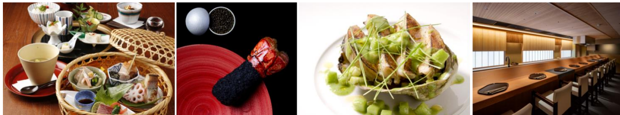
左から：銀座方舟 大吟醸しづく店、ESPRIT C. KEI GINZA、銀座 KAZAN、金田中 庵